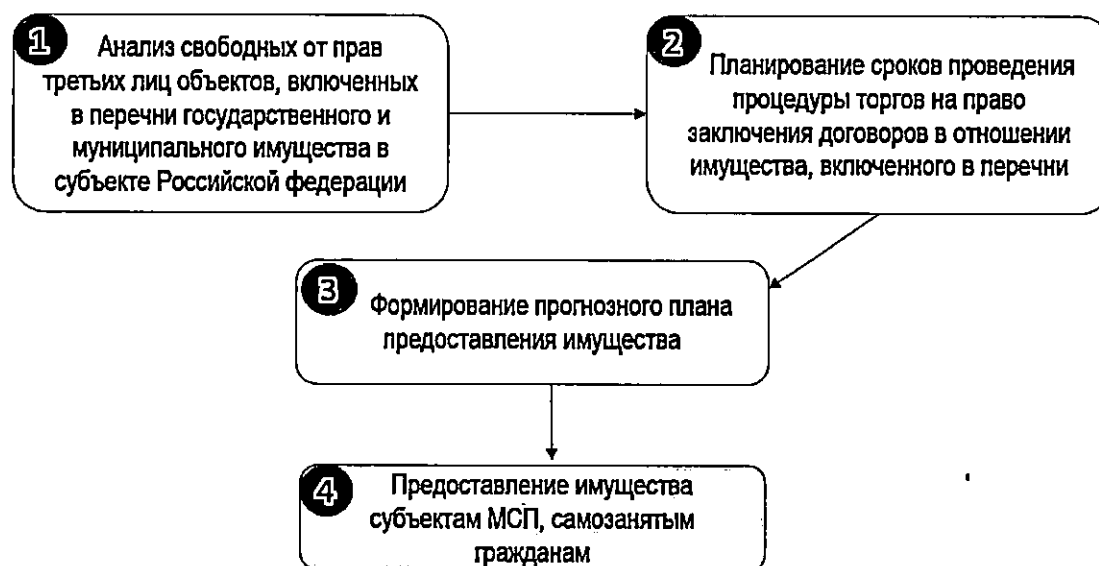
Рисунок 2. Схема формирования прогнозного плана предоставления имущества

9.13. Схема формирования прогнозного плана предоставления имущества отражена на Рисунке 2.